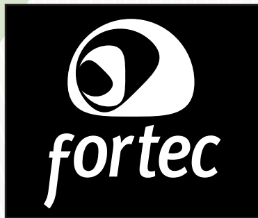
Aplicação P&B negativa